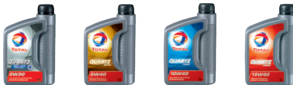
CITROËN recomienda los lubricantes TOTAL, especialmente desarrollados para sus motorizaciones

> Obtendrá un mayor rendimiento y una mejora de la vida útil de su motor, reducirá las emisiones contaminantes y de desgaste, y ahorrará combustible.